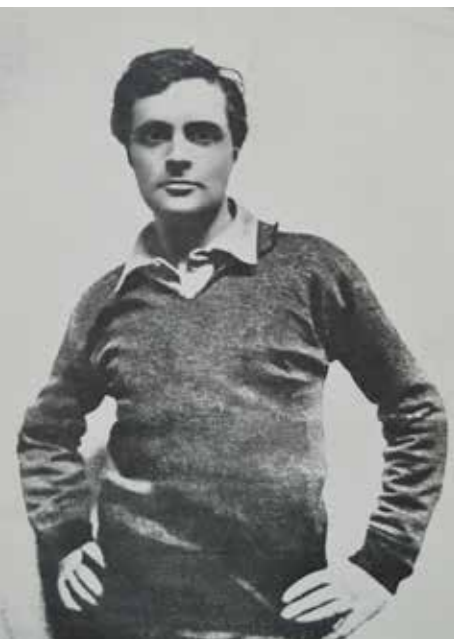
Ritratto di Amedeo Modigliani Portrait d'Amedeo Modigliani

Livorno, 12 luglio 1884 – Paris, 24 gennaio 1920