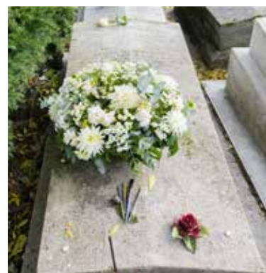
Tomba di Amedeo Modigliani, av. Transversale n° 3, 96ª divisione Tombeau d'Amedeo Modigliani, av. Transversale n° 3, 96ª division

P OVERO, SCIOCCO, COMMISSARIO ROUSSELOT, inconsapevole artefice del più grande evento mediatico e finanziario nel mondo della pittura, la vendita del Nudo di donna su cuscino blu , una delle opere più celebrate di Amedeo Modigliani, passata fra diverse mani di collezionisti, fino all'ultimo compratore che staccò un assegno di oltre 160 milioni di dollari. Fra quell'asta (la terza più alta valutazione della storia, dopo il Salvator Mundi , attribuito a Leonardo, e Le donne di Algeri di Picasso) e l'ingresso del commissario nella vita dell'artista passa un secolo. Siamo a Parigi, al 50 di rue Taitbout, nel IX arrondissement. Berthe Weill, mercante e gallerista molto attiva (è la prima a vendere Picasso), crede nelle qualità del giovane, bello e squattrinato, malaticcio e spesso ubriaco, che da quando (nel 1906) è sbarcato nella capitale si arrangia a vendere le opere per pagare affitti di gelide mansarde e infimi atelier, rimborsare debiti, saldare conti di bistrot.