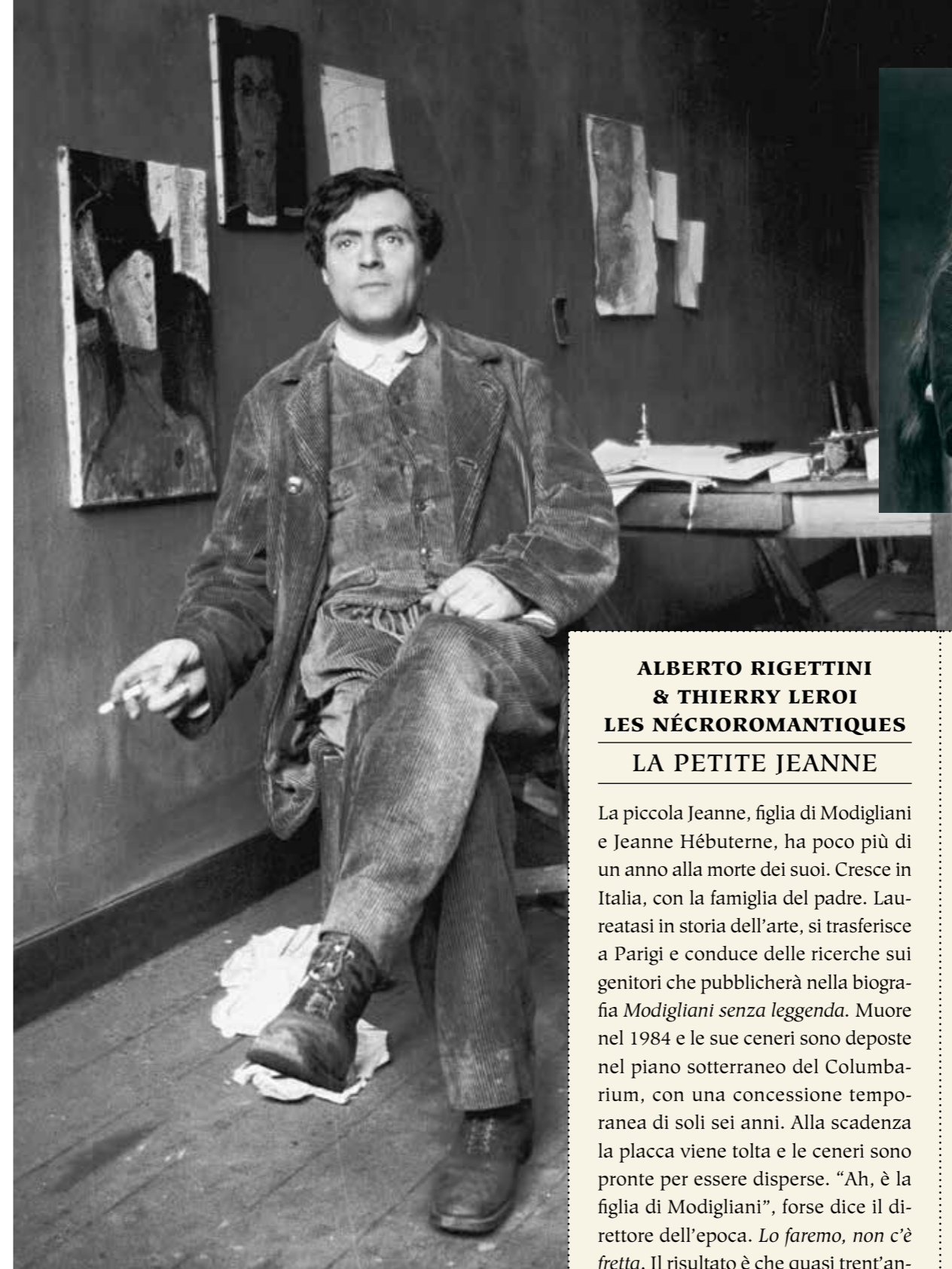
Modigliani nel suo atelier, 1915 Modigliani dans son atelier, 1915

Era timido, insicuro, ansiogeno nella ricerca di una consacrazione che non avrebbe assaporato da vivo. Ed era oppresso dall'impossibilità di garantirsi un tenore di vita dentro cui ritrovare serenità e sostegno per sé e i suoi cari. Modigliani sentiva di essere vicino alla morte. Negli ultimi giorni, secondo alcune testimonianze, lo sentirono canticchiare in lacrime una cantilena ebraica. Era il "Kaddish", la preghiera per i morti, l'unica conosciuta, non essendo credente.